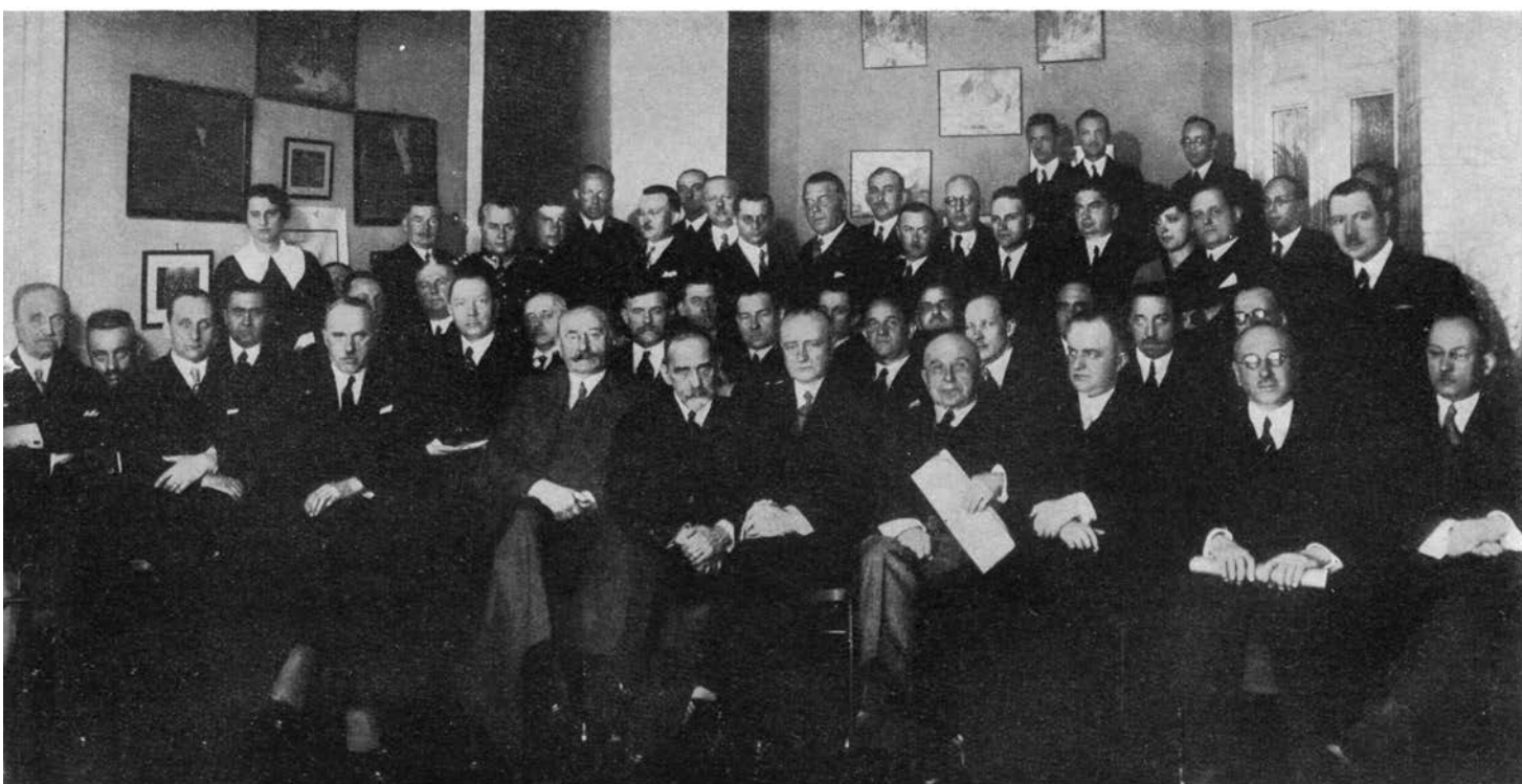
Jubileuszowy Walny Zjazd Członków Związku Uzdrawisk Polskich w Warszawie, dnia 25 kwietnia 1936 r.